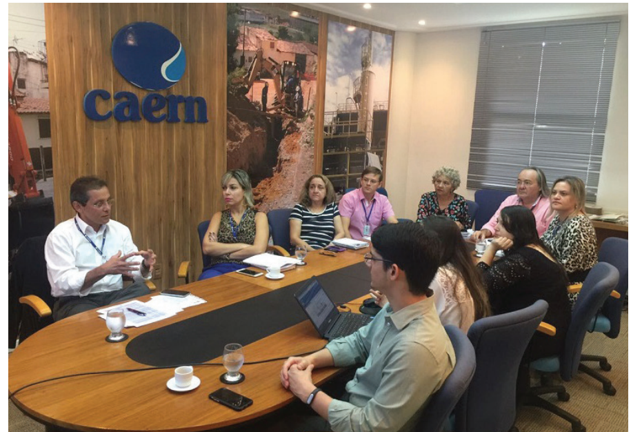
O contrato de gestão será assinado pelo governador do Estado, Robinson Faria e pelo presidente, Marcelo Toscano

O contrato de gestão será assinado pelo governador do Estado, Robinson Faria e pelo presidente da Caern, Marcelo Toscano, durante uma solenidade no começo do próximo ano.