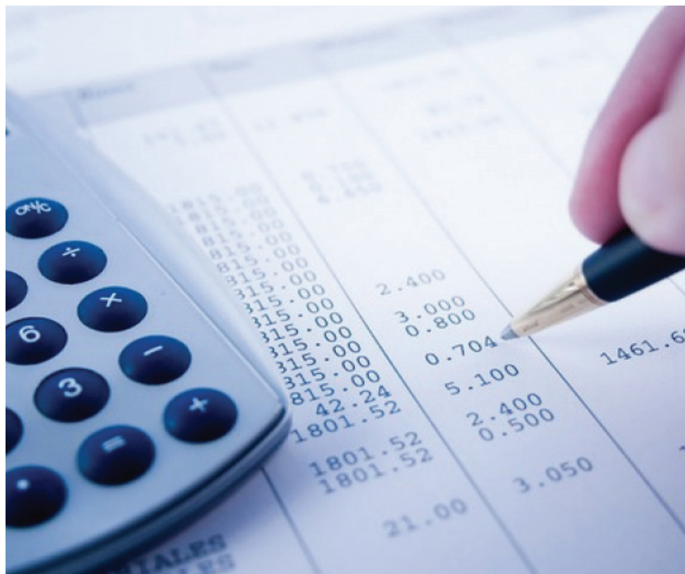
A adesão ao Refis traz vantagens para as empresas, já que regularizando a situação fiscal, é possível realizar operações de créditos

Dúvidas podem ser esclarecidas pelo telefone 3232-2736, pessoalmente na sede da Procuradoria Geral do Estado, na Avenida Afonso Pena, nº 1155, Tirol, Natal ou em um dos Núcleos Regionais.