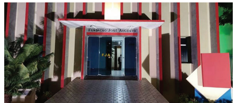
Os interessados devem preencher o formulário através do endereço: www.cultura.rn.gov.br

A cidade de Caicó que também está com seleção aberta para profissionais da arte, selecionam nas seguintes áreas: Dança, Capoeira, Teatro, Música-Flauta, Música-Percussão. Os interessados devem acessar o site www.cultura.rn.gov.br na sessão Edições culturais para o preenchimento do formulário.